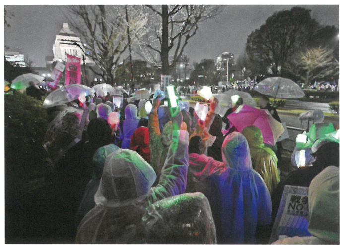
国会前で憲法改正反対を訴える人たち「東京新聞デジタル2026年3月25日」

自民政権は、「厳しく複雑な安全保障環境の下、日米同盟の抑止力の強化が必要」と軍備拡大を主張しています。抑止力、軍備の拡大は、軍拡競争の悪循環で緊張を高め、破綻のリスクを招き、指導者の誤解や偶発的な事故の危険性や、軍力への依拠で国際間の対話や協力の関係を弱め、信頼の崩壊をきたすなど、有害そのものです。日本政府も「防衛白書」で「安全保障環境が年々厳しくなる」と、抑止力では解決できないことを認めるほどです。 抑止力、軍備拡大で相手に恐怖を与えるのではなく、安心を与える9条にもとづく対話と外交でこそ平和は実現できます。