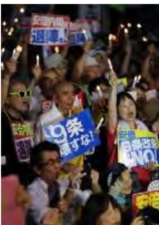
国会前で安倍政権の退陣を求める人たち＝東京都千代田区で2018年7月19日午後7時20分