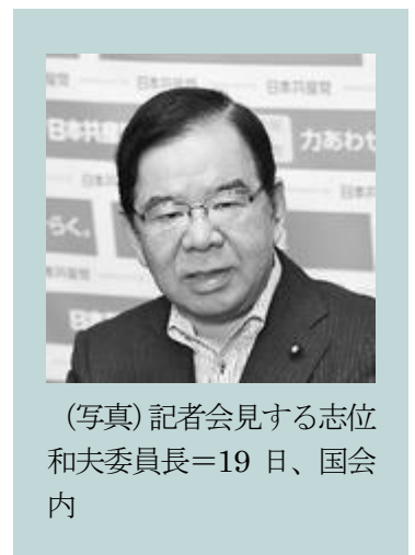
（写真）記者会見する志位和夫委員長＝19日、国会内