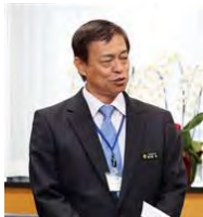
沖縄県の謝花喜一郎沖縄県副知事（代表撮