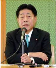
北側一雄・公明党中央幹事会会長