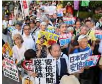
国会前で安倍政権の退陣を求める人たち＝東京都千代田区で2018年7月19日午後6時52分