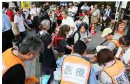
国会前で安倍政権の退陣を求める人たちの集会では給水所が設けられた＝東京都千代田区で2018年7月19日午後6時37分