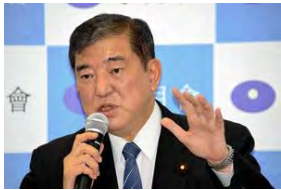
「防災省」の必要性について話す自民党の石破茂元幹事長