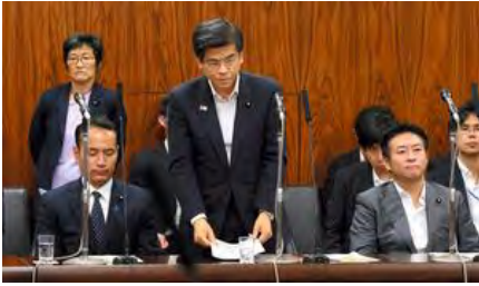
参院内閣委で、カジ

ノを含む統合型リゾート（IR）実施法案の付帯決議を受け、所信を述べて頭を下げる石井啓一国土交通相＝2018年7月19日午後4時56分、岩下毅撮影