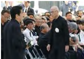
沖縄全戦没者追悼式で、献花

に向かう安倍晋三首相（手前左）を見つめる沖縄県の翁長雄志知事（同右）＝6月23日、沖縄県糸満市の平和祈念公園