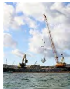
米軍普天間飛行場移設先の、沖縄県名

護市辺野古沿岸部。沖縄防衛局が護岸で囲い込む作業を終え、土砂投入の準備が整った＝19日午後