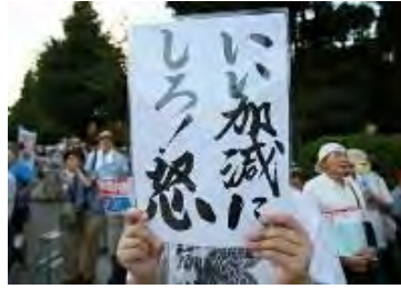
国会前で安倍政権の退陣を求める人たち＝東京都千代田区で2018年7月19日午後6時41分