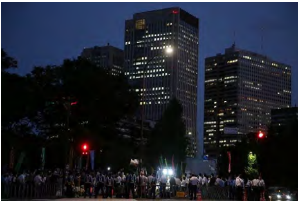
国会前で安倍政権の退陣を求める人たち＝東京都千代田区で2018年7月19日午後7時14分