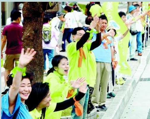
（写真）車で行き交う人たちにデニー候補への支持を訴えて手を振る人たち＝27日、那覇市

大激戦の沖縄県知事選（30日投票）で、勝敗を分ける「三日攻防」に突入した27日、