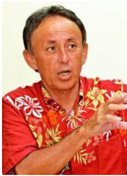
自身の政策について語る玉城デニー氏＝22日、那覇市古島